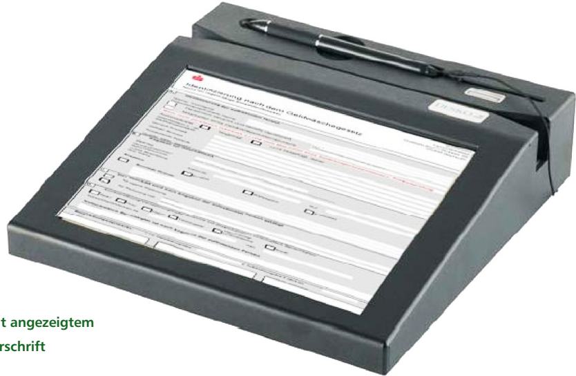
Signaturtablett mit angezeigtem Formular zur Unterschrift